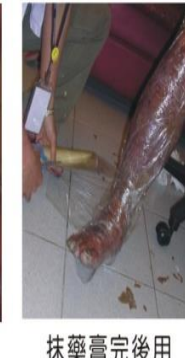
抹藥膏完後用 保鮮膜保溼