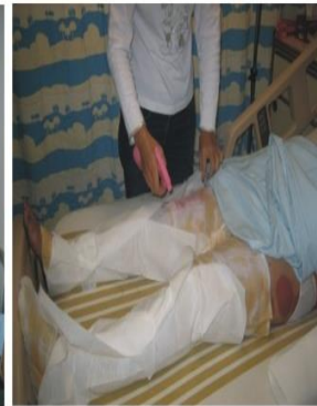
每20分鐘要噴水保濕 以免乾了紗布