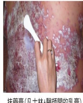
抹藥膏(凡士林+醫師開的乳膏)