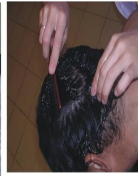
抹藥在頭皮上, 以免結痂