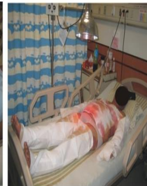
全身濕布24小時, 每一天 包裹藥敷