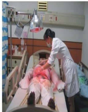
護士用紗布裹著藥膏用 保濕方式護理